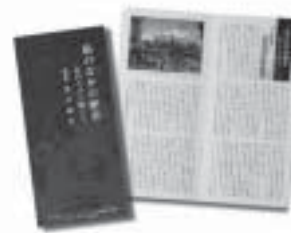
2013年5月31日～6月15日までの 道新夕刊掲載文を小冊子に

20代の始めに日本を代表する版画家の一人、駒井哲郎と銅版画の作品とに出会い、ほぼ独学で本格的に版画の道へ。人間と美酒と音楽をこよなく愛する。創作活動もチャレンジ精神もアクティブで年齢を感じさせない。展覧会は札幌を含め道内外や海外など多数。イギリス大英博物館や美術館などに作品收藏。詩情あふれる版画集、著書のファンも多い。