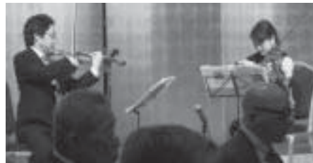
心地よい音色 ヴァイオリンデュオの演奏