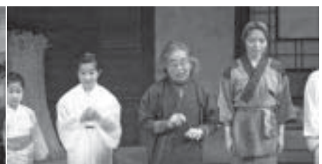
2月4日(日)かでの2・7かでのホールで上演後、舞台挨拶の出演者らと