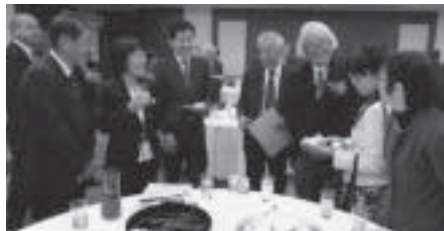
祝賀会での談笑も和やかに