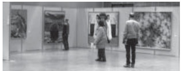
町民ホール展示室風景