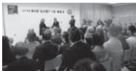
柴橋代表より賞状の授与

本業の画家の他に長年、美術館館長として多くの企画展の開催に携わる。演劇の脚本、演出家の顔を持ち道内、外の美術教育にも力を注ぐなど、まさにマルチに活動を展開している。昨年、創立 25 周年ふかがわ市民劇団公演を成功させた。今春は出演者など総勢 32 名を率いて札幌での初公演があり、観客から温かい拍手が贈られた。地方に立脚した発信者の存在は大きい。