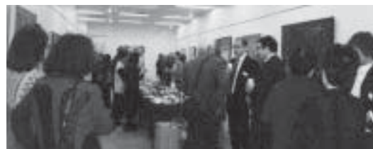
講評の後は和やかに歓談