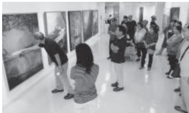
講評は勉強になります