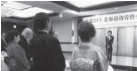
高橋はるみ北海道知事の祝辞