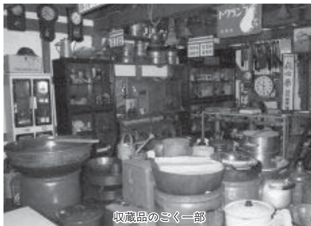
収蔵品のごく一部

私の「資料館」は、大正9年に建てられた煉瓦造の総面積60坪余りの洒落た建物で1993年に大規模リニューアルし、大量の収集物を並べ一度っ切りのつもりでその翌年のゴールデンウィークに公開した。