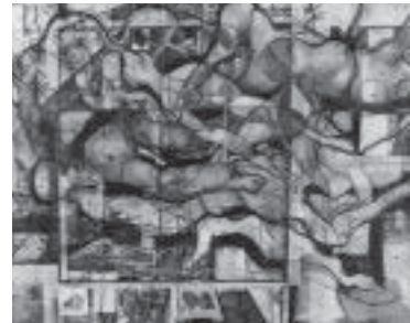
第72回全道美術協会賞 パッコスの信女 F200 木村 麻衣