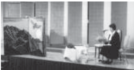
大型絵本「カムイチカプ」の朗読

木版画家であり、木版画絵本のバイオニア。北海道の自然界の厳しき暖かさを刻刀に込めた作品で、老人から幼児までが親しむ。ダイナミズムと清冽で繊細なタッチの作品は、日本国内はもとより海外でも高い評価を得て数々受賞、翻訳も多い。毎年のように出版、'87、'88 ニューヨークタイムズ選世界の絵本ベストテンに選ばれた。昨年、絵本 36 作品などで構成され集大成となる「手島圭三郎全仕事」が刊行された。